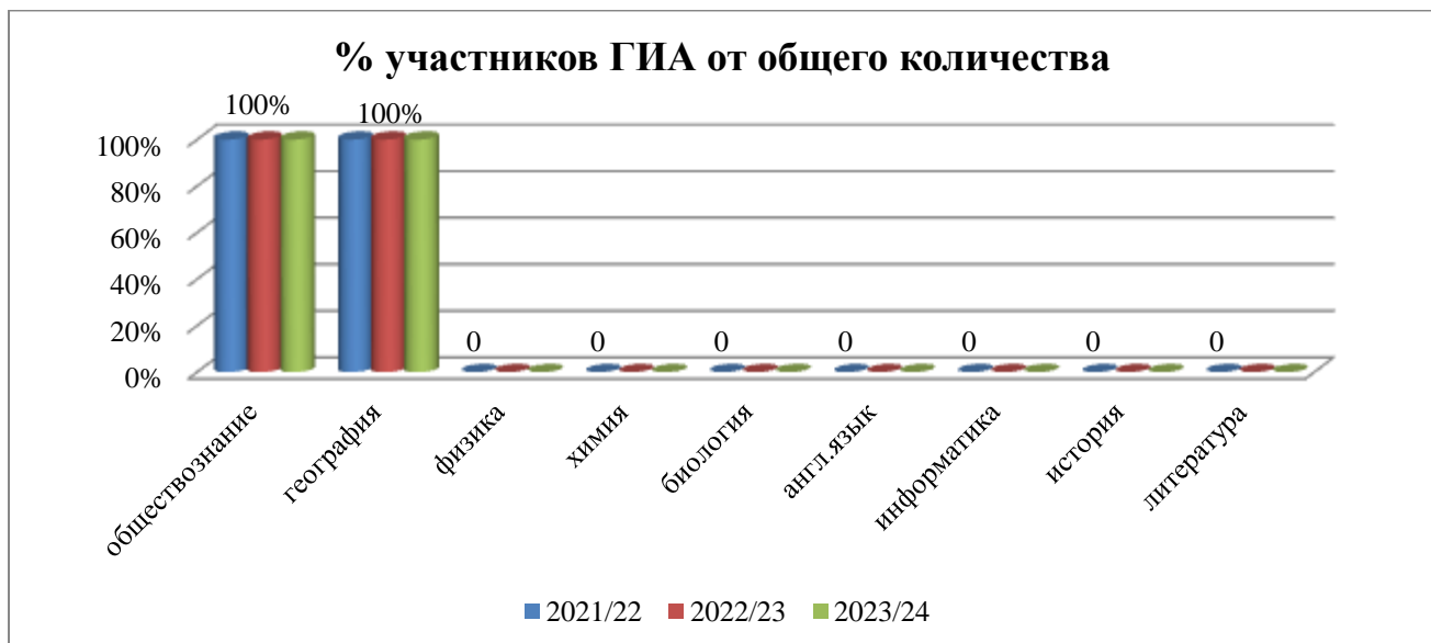
Сравнительная таблица результатов государственной итоговой аттестации в формате ОГЭ по обязательным предметам